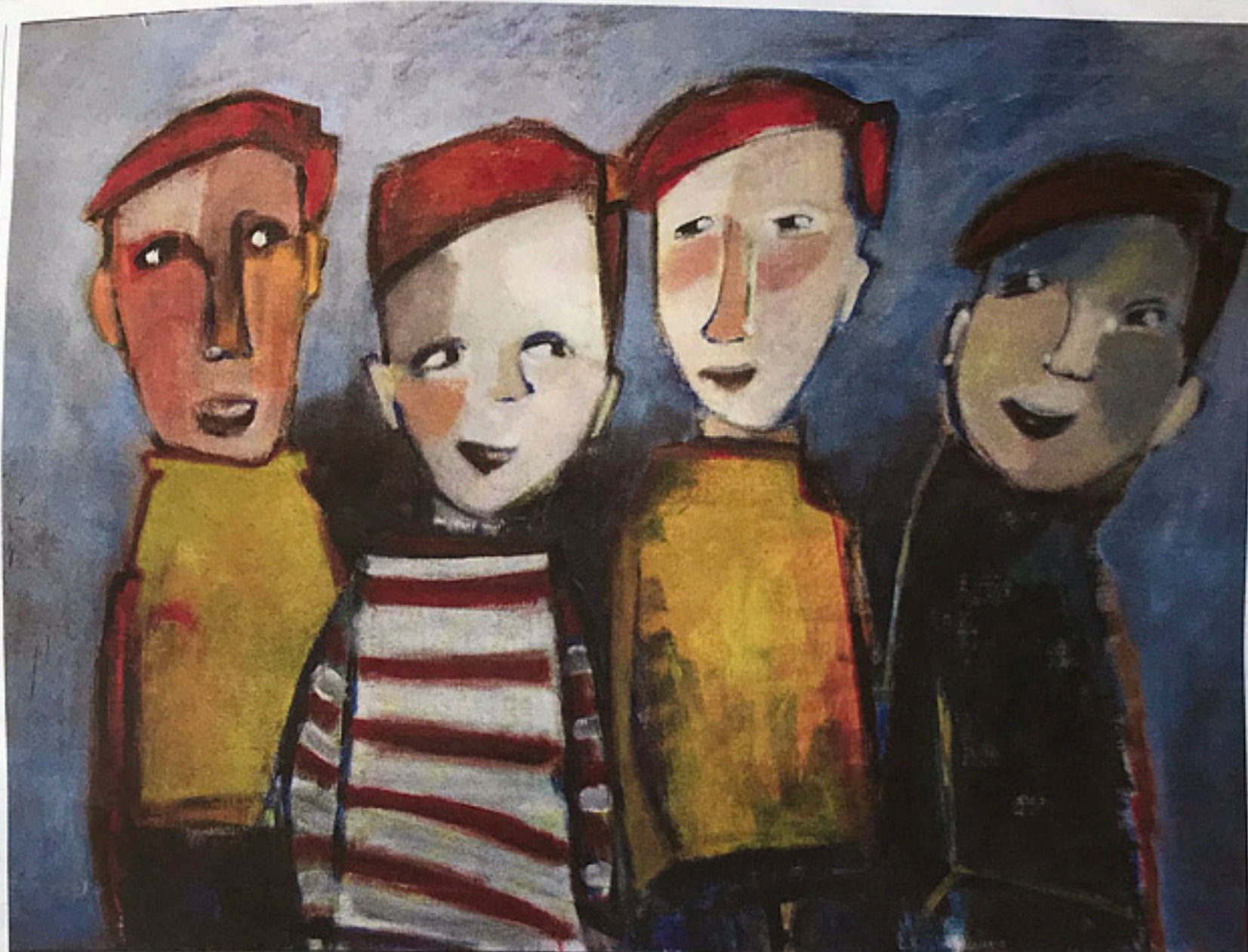
"De rödhårigas gäng med benan åt samma håll".