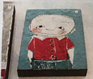
"Jag har en bra idé" av Elisabet Linna Persson.