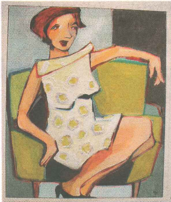
Med bygel-bh och hålfotsinlägg.