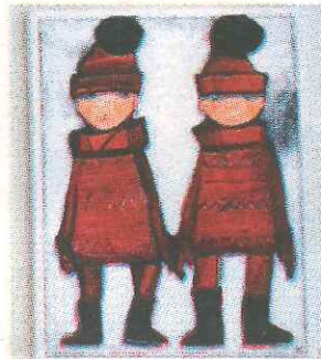
Vad ska vi göra nu.

Det är som att ramla tillbaka ner i 1960-talets estetik med glada färger i rött, gult och blått och bilder med ifyllda konturer. Som optimistiska barnboksillustrationer eller kanske modereportage i veckotidningar – klänningarna är tjustiga trots att modellen sitter ner. Och dessa runda barnansikten,