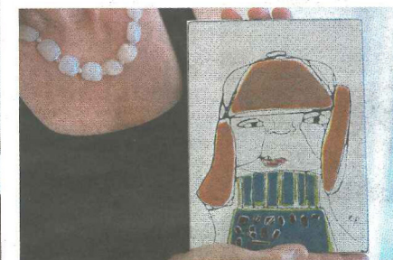
EMALJ. Verket Vintervän är en emalj som föreställer en flicka i ett kallt landskap.