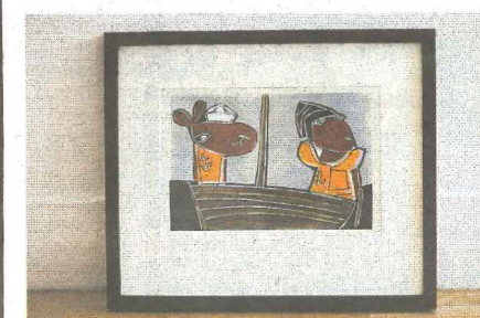
GRAFIK. Grafiken Skepp ohoj handlar om att vara på väg någonstans - på sjön eller i livet.